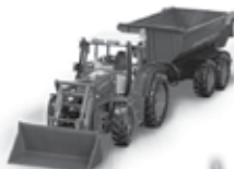
20 111 9286 FARMER SET