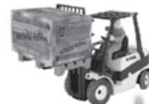
20 111 9896 FORKLIFT CLARK C25