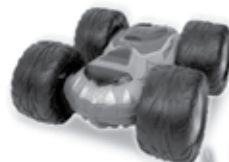
20 111 9063 WILD FLIPPY