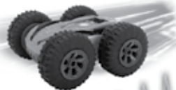
20 111 9076 MINI BASHER