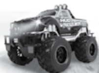
20 111 9455 MUD WRESTLER