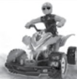
20 111 9403 KAWASAKI KFX 450R