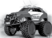
20 111 9056 POLICE OFFROADER