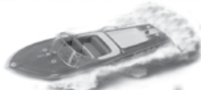
20 111 9067 BELLA LUISA