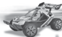
20 111 9480 DESERT STRIKER