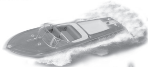
20 111 9067 BELLA LUISA