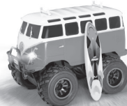
20 111 9408 T1 WHEELY BUS