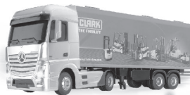
20 111 9884 MERCEDES-BENZ ACTROS