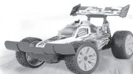
20 111 9052 DIRT SLAMMER