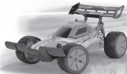
20 111 9064 X-2R RACER