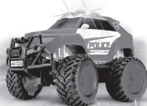
20 111 9056 POLICE OFFROADER