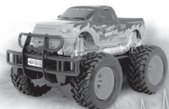
20 111 9051 CRAZY MONSTER