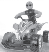
20 111 9403 KAWASAKI KFX 450R