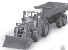
20 111 9266 FARMER SET