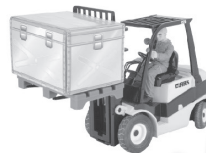
20 111 9886 FORKLIFT CLARK C25