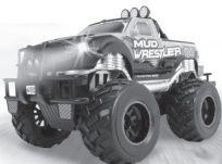
20 111 9055 MUD WRESTLER